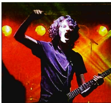
... „Broken Mirror“, ...