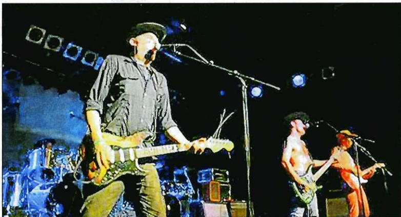
... „Sons of Explosivos“ auf der Bühne.